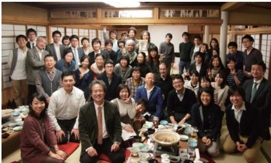
▲参加者全員での記念撮影!