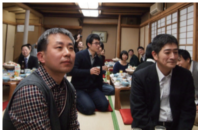
▲ Also took part in the end of year party

He said that collective landscapes can be formed by the different people and the different ideas that we encounter daily. Personal Landscapes are formed from an individual's personal perspective on the things around him. For example, for him, some of the thoughts that come to mind when he thinks of different countries are Netherlands (land vs nature), Thailand (happiness, smiling) and Taiwan (guesthouse). Some of his travel thoughts are that landscape plays an important role in changing a person's mental