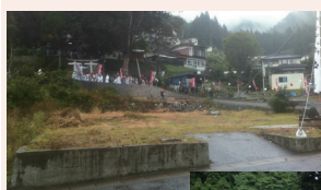
▲今年の八幡神社のお祭り