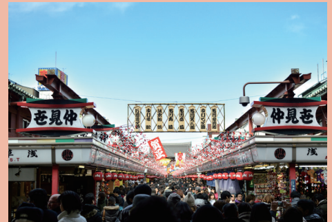
▲ Nakamise Dori