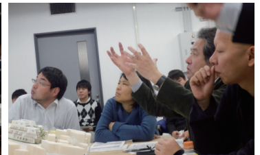
▲発表に答える先生方