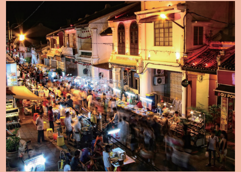
▲ Jonker Street