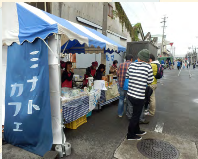
▲清水ゆかりの品を販売する「ミナトカフェ」

このパネルディスカッションだけでなく、清水みなと散歩開催に向けた準備の過程では、清水に関わる多くの人とつながりを持つことができ、またそうしてつながった方々と協力し、何度も助けていただいてイベントを開催することができました。こうした点で、今年度の目標であった「(清水を愛し、行動を起こすことのできる)清水のサポーターを増やす」への大きな一歩を踏み出すことができたのではないかと感じました。