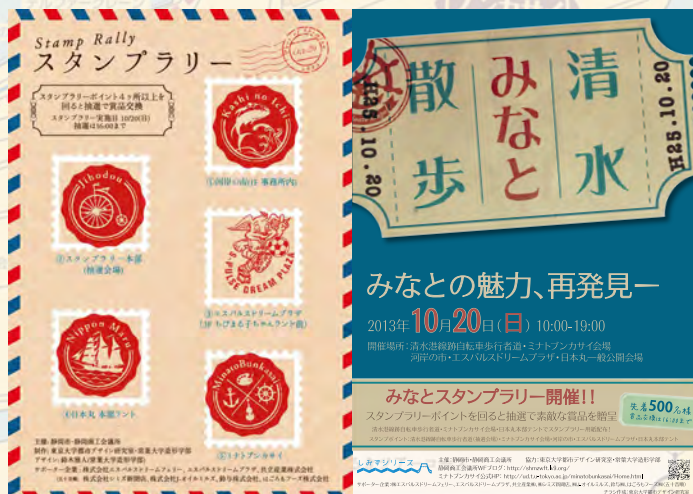
▲スタンプラリー台紙