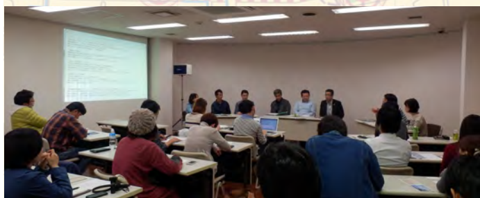
▲非常に盛り上がった「みなとトーク!」