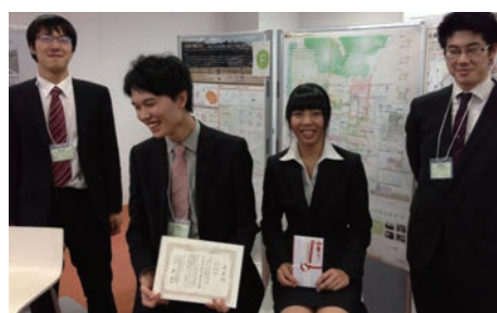
▲授賞後にパネルの前で記念撮影

このような歴史と現状分析による問題発見から全体の空間提案につなげた点を評価され、土木計画学委員会賞を授賞しました。発表に向けた準備や当日のプレゼンとポスターセッションを経て、案を形として表現し伝えることの困難さと重要性を実感しました。