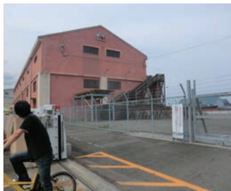
▲海沿いの県営上屋を眺める