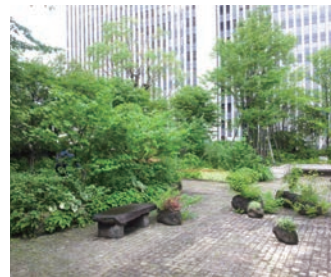
▲ A hidden space

Another was a secluded park hidden upstairs behind high-rise buildings, which made it harder to find but also acted as sound barriers for street sounds. And for me, they also provided an exotic fond.