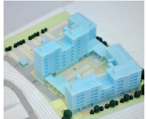
▲陸前高田市の物件の模型