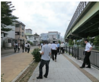
▲地元の方と自転車道を調査

6月30日（日）より2日間行った現地調査では、市が積極的な利用を検討している、清水港線跡を利用した自転車道を対象に、周辺空間を含めた調査を行い、さらに様々な立場の方と意見交換を行いました。現状は利用者が使いやすい空間ではないですが、港と駅を繋ぐ動線として市民に親しまれる空間となるよう、検討を行いたいと思います。一方、これまでPJチームが目撃してきた日の出地区では、ウォーターフロントの活用可能性を検討するため、海沿いの県営上屋の調査を行いました。また昨年社会実験を行った石造倉庫群の重要性を今後さらに認知してもらうために、倉庫群を所有する企業や地元NPO、大学の方々と、今後の可能性について意見交換を行いました。港全体での位置づけや老朽化など様々な課題がありますが、地元の方とともに継続性のある活動を行えればと思います。