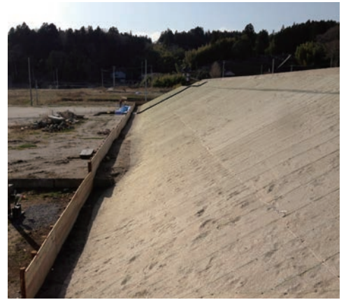
▲先行的に嵩上げされた市街地の風景