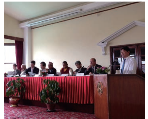
▲首都カトマンズでの記者会見

これで1つの区切りはつきますが、今後もルンビニでの支援が続けられるよう関係者各位調整中です。これからもルンビニPJにご期待ください。