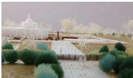
▲1:200 模型写真—北側からアショカ・ピラーを望む

ルンビニは丹下健三が作成したマスタープランに則って長年整備が続けられてきましたが、世界遺産登録後の観光客の急増やマスタープラン整備の遅れ等により遺跡の保全が困難となっていました。そこでユネスコが日本政府の援助を得て、新たな保全方針を模索するため西村先生をリーダーとした国際専門家チームを組織し、遺跡の化学的保存、考古学調査、保全計画の見直し、の3チームが活動を行なってきました。私