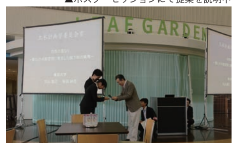
▲土木計画学委員会賞を授賞しました