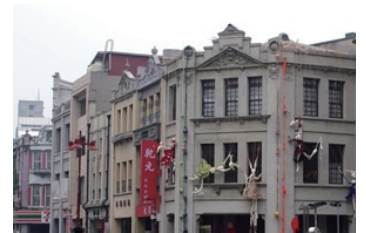
▲URS44 ( http://bit.ly/L5ktJR )