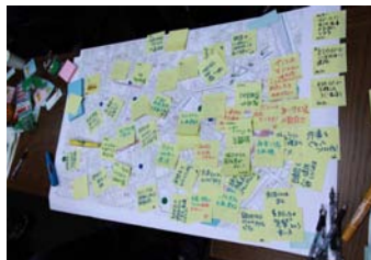
▲参加者から神楽坂への思いが集まる