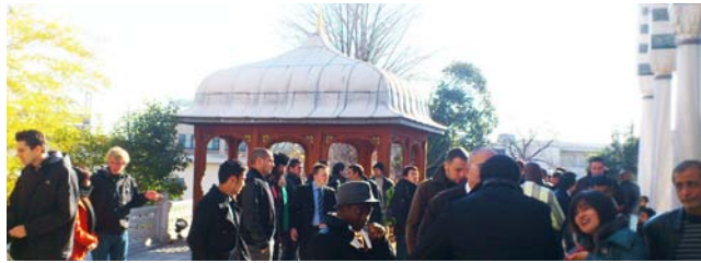
▲集会後の立ち話の様子。様々な人種の人が集う。