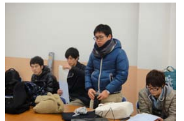
▲学部3年生も大活躍!