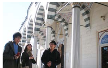
▲日本である事を忘れてしまうような雰囲気

その後の礼拝見学では、女子はスカーフを巻き、男女別々の場所から金曜礼拝に参加しました。モスク内を埋め尽くす人々がお祈りを捧げる光景に、改めて宗教や文化について考えてみたくなりました。