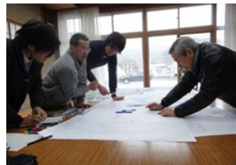
▲地図に撮影地をプロット

やはり普段の街の様子の写真は少なく、祭りの写真が大半でしたが、何気ない日常の写真や戦後すぐの写真なども集まり、被災前の大槌町の暮らしがだんだんと明らかになりました。町民のみなさんの温かいご協力にも非常に感動しました。