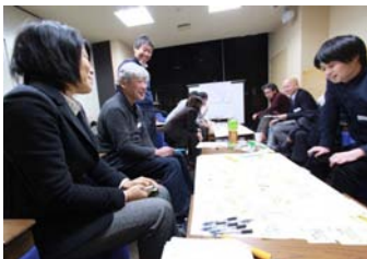
▲ワークショップの様子

印象に残ったのは、行動を起こして小さくても1つ成功例を作ることが大事だという話です。当日出た具体的な取り組み案をまとめ、今後の作戦を練ろうと考えています。今後もネットワーク軽く、まちの中で動きながら考えていきたいです。