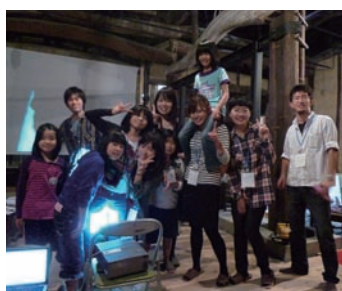
▲缶バッジをつけてみんなで記念撮影