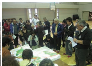
▲赤浜小での住民会議