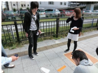
▲自転車道にシールが貼れるか試行

10月18日（月）と19日（火）に清水PJの現地調査を行いました。初めての泊まりがけでの調査となり、調査内容の充実さは勿論、夜を通しての話し合いによりメンバーの結束力も高まったと思います。2日間の内容は、11月23日（水）に実施する社会実験の下見などの調査班と、民間企業などへのヒアリング班に分かれて行いました。調査班では、社会実験実施場所である自転車専用道路の舗装の色が変わるアクシデントも発生しました。社会実験まで一か月を切り焦りも交じってきましたが、今まで以上に気を引き締めて取り組んでいく所存です。