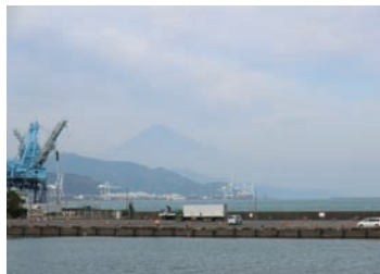
▲現地調査で初めて富士山を望む