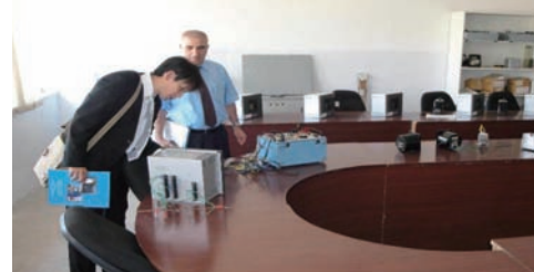
▲ヨルダン電力研修所視察の様子