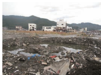
▲市街地で今も残る湧水池

10月15日（土）と16日（日）に大槌町の文化遺産調査を行いました。大槌町はもともと、豊かな湧水に恵まれ、生活の風景の一部となっていた町で、調査では震災後の湧水の現状を確認しました。多くの建物が流された市街地には今も自噴している湧水が見られ、里山の麓の小川では生物の気配も感じられました。虎舞や鹿子踊といった町の伝統芸能と合わせて、こうした自然も大槌町復興への手がかりとしての可能性を感じられました。また16日は赤浜地区の住民会議に参加しました。会議では地区の有志からなる「復興を考える会」から、住民に向けて復興案の発表が行われました。発表では3年生製作の模型が使われ、多くの住民が真剣に耳を傾けている姿が印象的で、復興に懸ける思いを感じられるものとなりました。