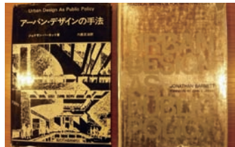
▲バーネットの『都市デザインの手法』