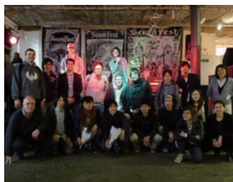
▲WS後の写真。お疲れさまでした！