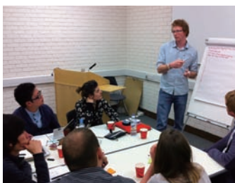
▲ラフバラ大生とのディスカッション

今後は現地で得られた情報をもとに、実際に行われているペッカム再興の議論に、東京大学として提案をする予定です。