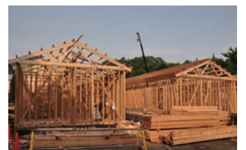
▲木造の仮設住宅建設が進む