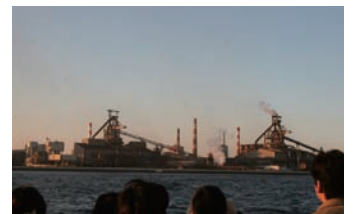
▲京浜臨海部を眺める