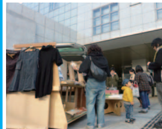
▲制作したモバイル施設の実験

自分たちでできることからカタチにしていく。これをモットーに今後も継続して活動していきます。ちなみに、2010年度はG空間 EXPO 学生フォーラム、建設コンサルタンツ協会学生懸賞論文で受賞しました!