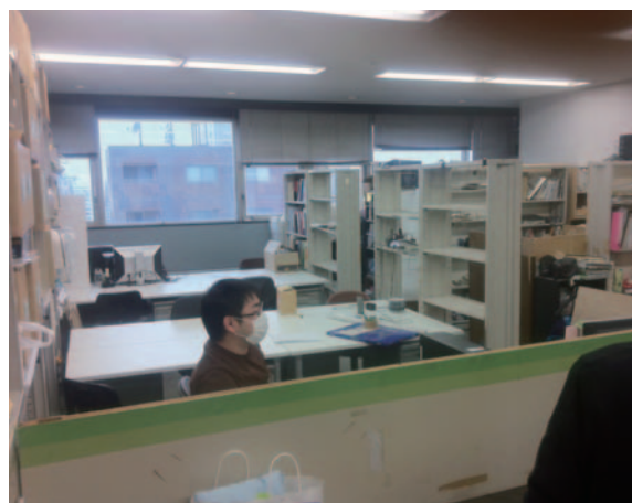
▲大掃除後日当り良好な空間に大変身