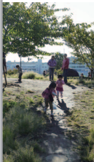
▲制作した作品で遊ぶことも運

修士の二年間、友人と共に建築・プロダクトデザインやインсталレーションなど様々なコンペに参加しました。いくつかのコンペでは実際に作品を制作する機会も与えていただきました。全く知らない分野に悪戦苦闘し、時には友人や後輩などの協力も得ながら、なんとか完成にこぎつけることができました。このように自分達のアイデアを実際の形にしていく難しさ、そして楽しさを知ることができたのはとても貴重な経験となりました。勝っても負けても、自分で考え抜いたという経験は絶対に今後の糧になるはず! 皆さんも空き時間を有効活用しながら是非コンペにチャレンジしてみてください!