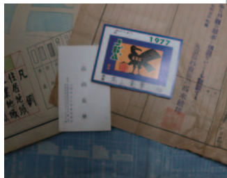
▲様々な図面、文書、名刺 etc.