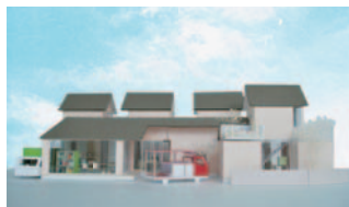
▲集合住宅の設計スタディ

balloon urban design partners -since 2009-