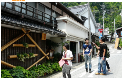
▲調査しながらも熱い議論を交わす

8月1日から5日まで現地調査に行ってきました。快晴の空の下、東西に伸びる塩の道沿いを歩くのはとても暑く、夏のフィールド調査の大変さを知りました。