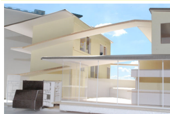
▲2つの敷地で集合住宅を設計

この夏は2つのスタジオで考えたことを整理し、対象地である柏ビレジにて展示会を行っています。住民の方の生の声をダイレクトに聞くことが出来、スタジオに続いて刺激的な時間を送ることができています。お時間があれば、ぜひ展示会に足をお運びください。(詳細は前号情報欄を参照してください)