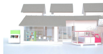
▲「たなカー」の停留所も同時に設計