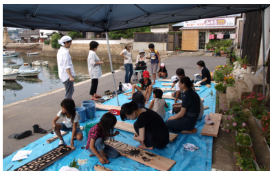
▲たくさんの人が参加してくれました

去る7月31日(土)に開催された茶屋蔵を舞台とした2回目のワークショップ。内容は、鞆に住む方、特に子供を対象に、一人一枚の床板に墨で絵や言葉を描いてもらい、各々の名前を刻印するというもの。事前に呼び掛けておいた子供から、当日チラシを見て来てくれた子供や近所の方、或いは通りすがりの観光客の方まで総勢25名程度の方に参加してもらい、手形、足形、