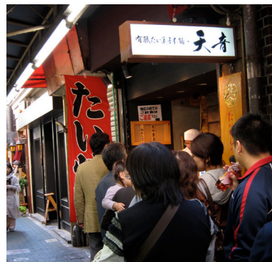
▲ハーモニカ横丁のにぎわい