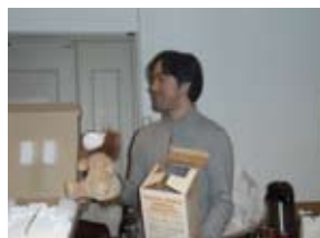
▲追出しコンパの様子 研究室を旅立つ方々