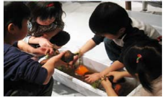
▲子どもたちが参加したワークショップの様子