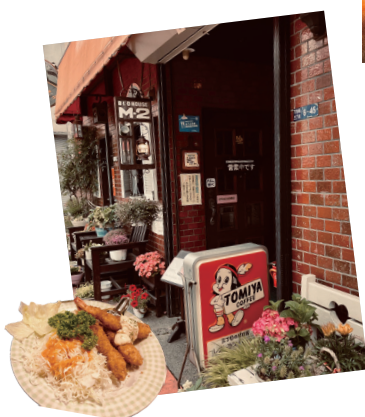
▲メンバーも通ったという富士吉田の洋食屋「M2」