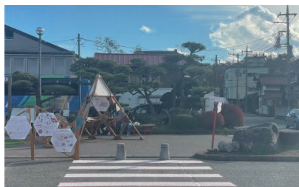
# 富士吉田プロジェクト

11/16、17に下吉田駅前で交通・滞留・回遊をテーマにえきまちエリアのあり方を検討する社会実験を行いました！特に駅前の歩行者ペイントは好評で、人の流れが変わるのを実感しました。(M1 木村)