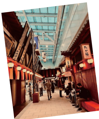
▲ターミナル内の施設「江戸小路」