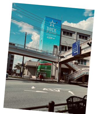
▲球場の方向を示す建物の壁面装飾

今回の取組みは、球団のファーム施設が追浜公園内へ移設予定であることを受け、京急電鉄・横須賀市・横浜 DeNA ベ이스ターズの 3 者が締結した連携協定の一環として行われた。協定には、野球の振興や地域活性化に関する協力体制構築のほか、球団施設の来訪に関連した京急線の利用促進、ファン層の拡大などが盛り込まれている。