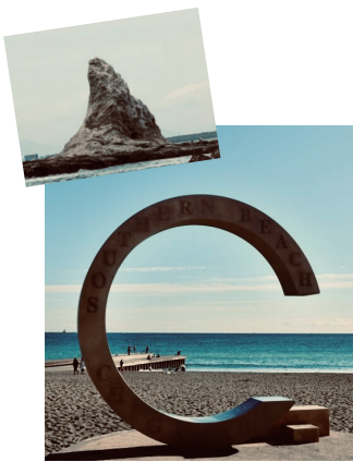
▲「えぼし岩」と「サザンビーチ」のモニュメント