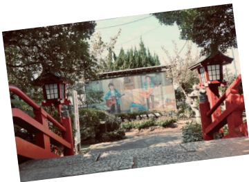
▲ゆずの壁画が飾られている地元の神社「岡村天満宮」

『この長い長い下り坂を 君を自転車の後ろに乗せて ブレーキいっぱい握りしめて ゆっくりゆっくり下ってく』