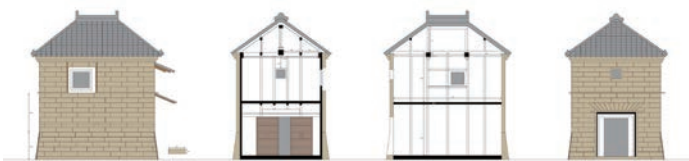
▲蔵の実測から描き出した図面