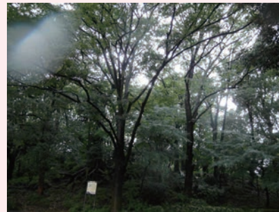
▲ Meiji Shrine(Tokyo)

good for development and the economy, the place slowly loses its historical character and becomes "soulless", like a modern robot with no soul. Like Ying and Yang, I think that there should be a balance between the old and the new, between nature and man, and I would like to see my hometown become something like the Omotesando area in the future.