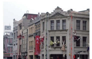
▲URS44 ( http://bit.ly/L5ktJR )