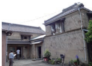
▲L字型に向かい合う二棟の蔵

使われました。石壁に使われている伊豆石の寸法が、日の出埠頭の切妻倉庫群と同じ規格であることも分かり、今後のプロジェクト活動に光明を見出す調査となりました。