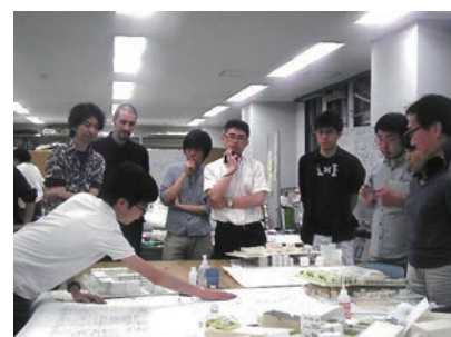
▲先生方が勢揃いしてのエスキース